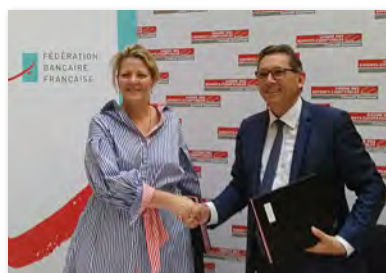
Marie-Anne Barbat-Layani, Directrice générale de la FBF et Charles-René Tandé, Président de l'Ordre des experts-comptables lors du lancement de la plateforme Dispositif Crédit 50 K€ le 4 juillet 2018.

Pour accompagner le déploiement de cette plateforme, la FBF mobilise son réseau de comités territoriaux et renforce ainsi la relation avec les représentants de l'Ordre des experts comptables sur le terrain.